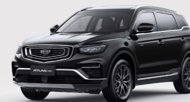
Ink Black Черный металлик