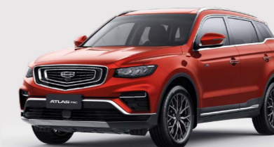
Flame Red Красный металлик