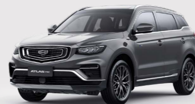
Titanium Grey Серый металлик