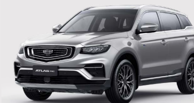
Pearl Silver Серебристый металлик