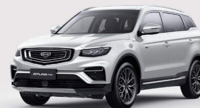
Crystal White Белый