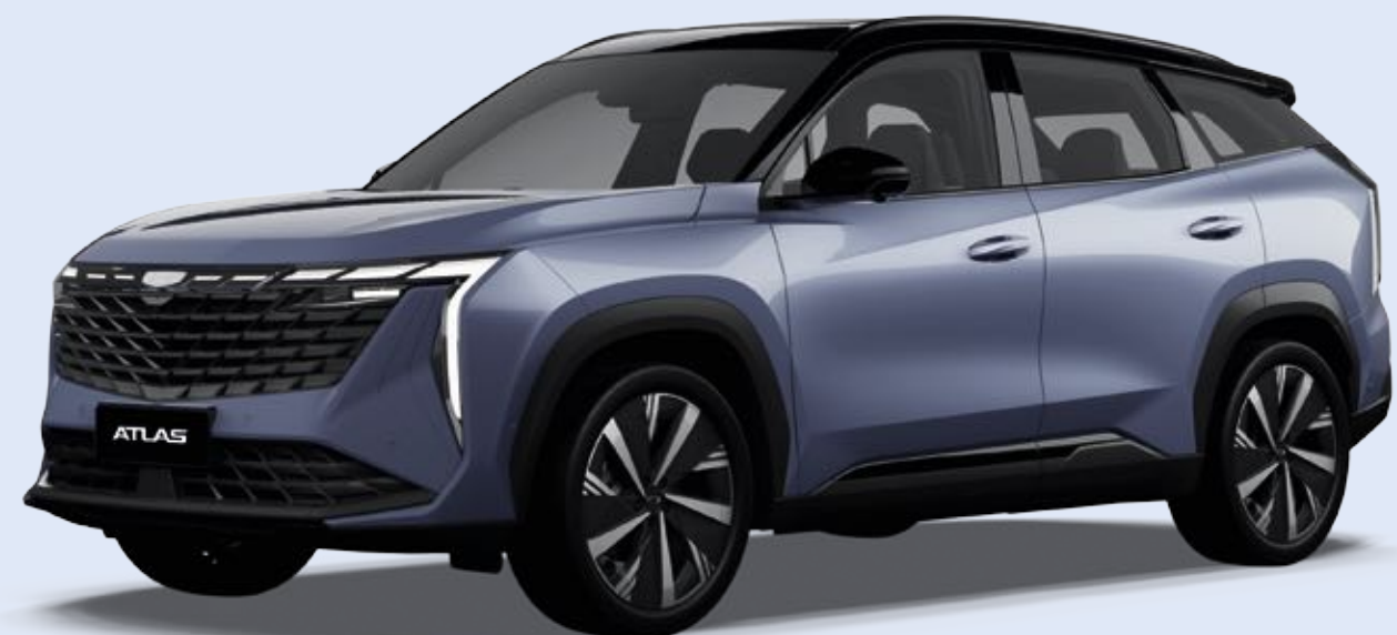
Серо-голубой металлик Starry Blue